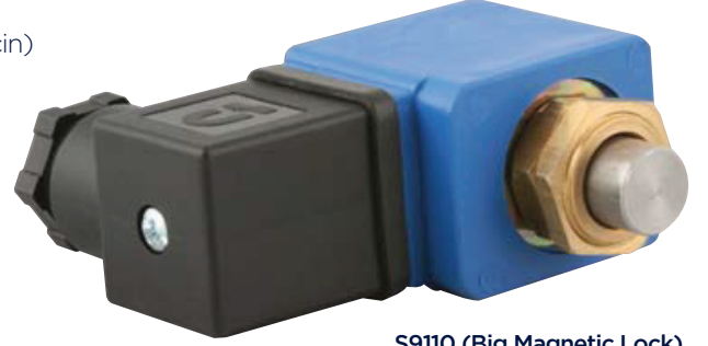
S9110 (Big Magnetic Lock)